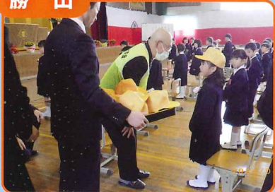
市内小学校の新1年生に交通安全帽子を贈呈しました