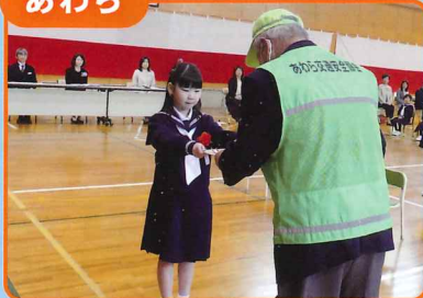
市内小学校児童に「交通安全下敷き」や自転車安全ブック等を贈呈しました