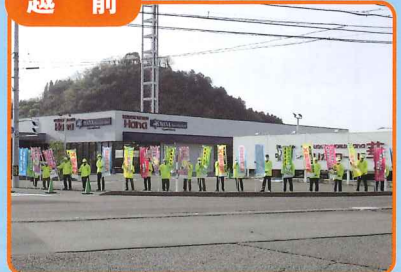
幹線道路において「交通事故死ゼロを目指す日」の街頭監視活動を行いました