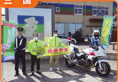
幹線道路で交通安全茶屋を開催し交通安全を呼びかけました