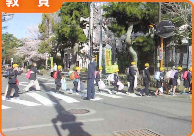
新一年生・初登校日に市内一斉の街頭啓発活動を行いました