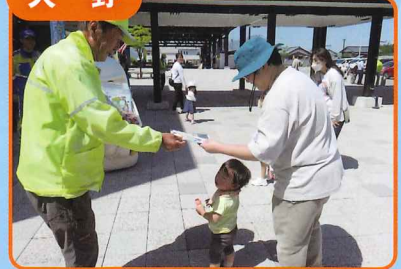
道の駅「荒島の郷」で反射材等を配付し交通安全を呼びかけました