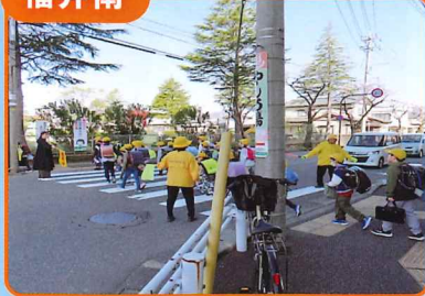
各地区で児童等の登校時の見守り活動を行いました