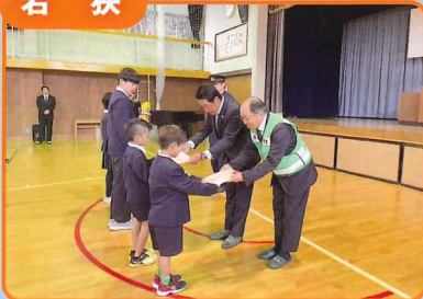
市内小学校児童に「交通安全横断旗」「交通安全下敷き」を贈呈しました