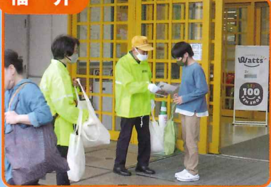
市内量販店でチラシ・反射材等を配付する街頭活動を行いました