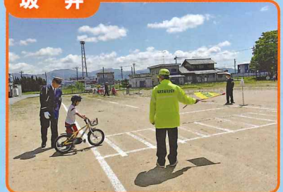
市内小学校で歩行中と自転車利用時の交通安全教室を行いました