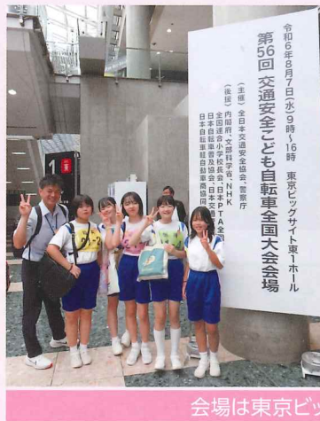
会場は東京ビックサイト