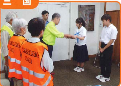
三国中学校生徒に夜間の事故防止を目的とした自転車反射材を贈呈しました