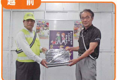
菊花マラソン実行委員会へ、ランナー等に向けた交通安全の反射タスキを贈呈しました