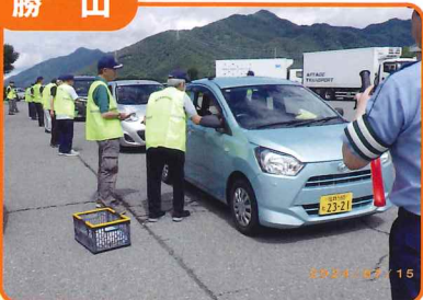
恐竜ロードパーキングにおいて交通安全茶屋を開催し交通安全を呼びかけました