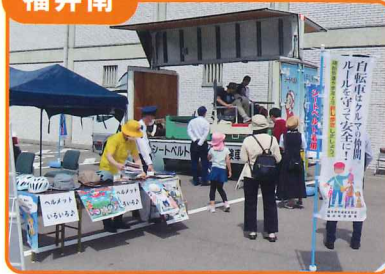
一乗谷朝倉氏遺跡で自転車ヘルメット着用とシートベルト体験車等を用いて交通安全啓発活動を行いました