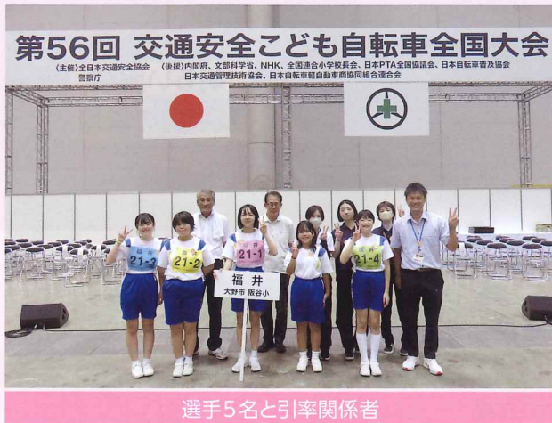
選手5名と引率関係者