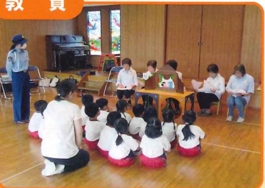
こども園で園児に対して交通安全教室を開催し交通安全紙芝居を行いました