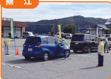
交通安全茶屋を開催し交通安全を呼びかけました