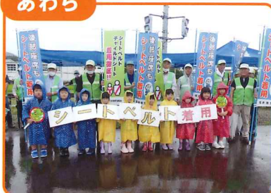
こども園児たちとシートベルト・チャイルドシート着用の街頭啓発活動を行いました