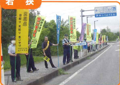
交通安全茶屋・街頭啓発活動を行いました