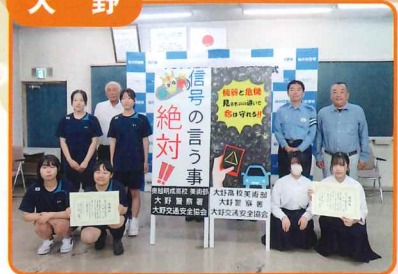
大野高校、奥越明成高校から「交通安全立て看板」の寄贈を受け啓発活動に活用しています