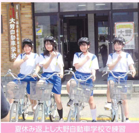
夏休み返上し大野自動車学校で練習