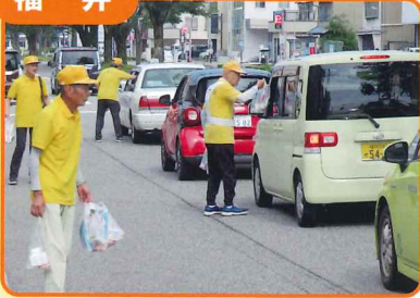
交通安全茶屋を開催し交通安全を呼びかけました