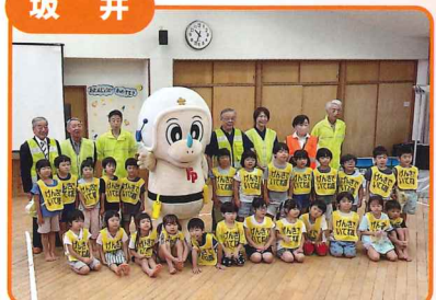
児童園で交通安全教室を実施し園児に元気でいてね隊を委嘱しました